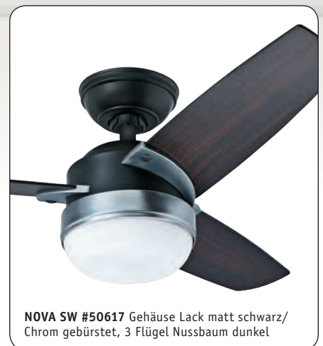
NOVA SW #50617 Gehäuse Lack matt schwarz/Chrom gebürstet, 3 Flügel Nussbaum dunkel