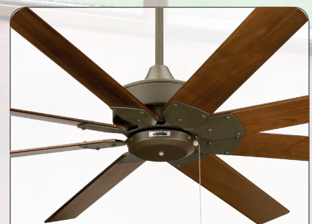
THE LEVON OB #FP7910OB, Gehäuse Oil rubbed bronze, 8 Flügel Nussbaum