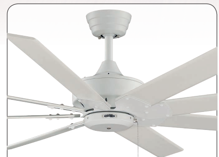
THE LEVON MW #FP7910MW, Gehäuse Lack weiß matt, 8 Flügel Weiß matt