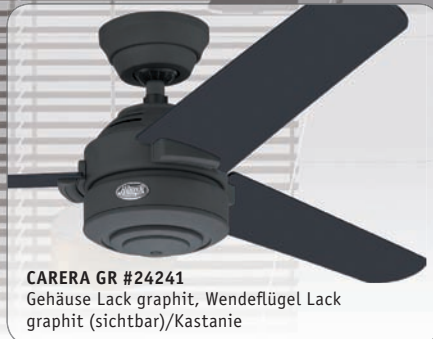
CARERA GR #24241 Gehäuse Lack graphit, Wende Flügel Lack graphit (sichtbar)/Kastanie