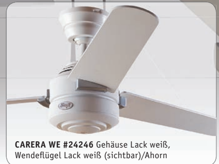
CARERA WE #24246 Gehäuse Lack weiß, Wende Flügel Lack weiß (sichtbar)/Ahorn