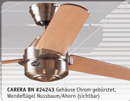
CARERA BN #24243 Gehäuse Chrom gebürstet, Wende Flügel Nussbaum/Ahorn (sichtbar)

Gehäuse Lack graphit, Wende Flügel Lack graphit/Kastanie (sichtbar)