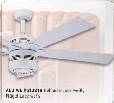
ALU WE #513219 Gehäuse Lack weiß, Flügel Lack weiß