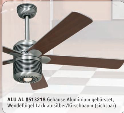
ALU AL #513218 Gehäuse Aluminium gebürstet, Wendeflügel Lack alusilber/Kirschbaum (sichtbar)