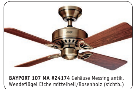
BAYPORT 107 MA #24174 Gehäuse Messing antik, Wendeflügel Eiche mittelhell/Rosenholz (sichtb.)