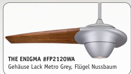
THE ENIGMA #FP2120WA Gehäuse Lack Metro Grey, Flügel Nussbaum

THE ENIGMA #FP2120MG mit Gehäuse und Flügel in Metro Grey und Leuchte sichtbar